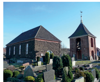
Deichkirche in Carolinensiel