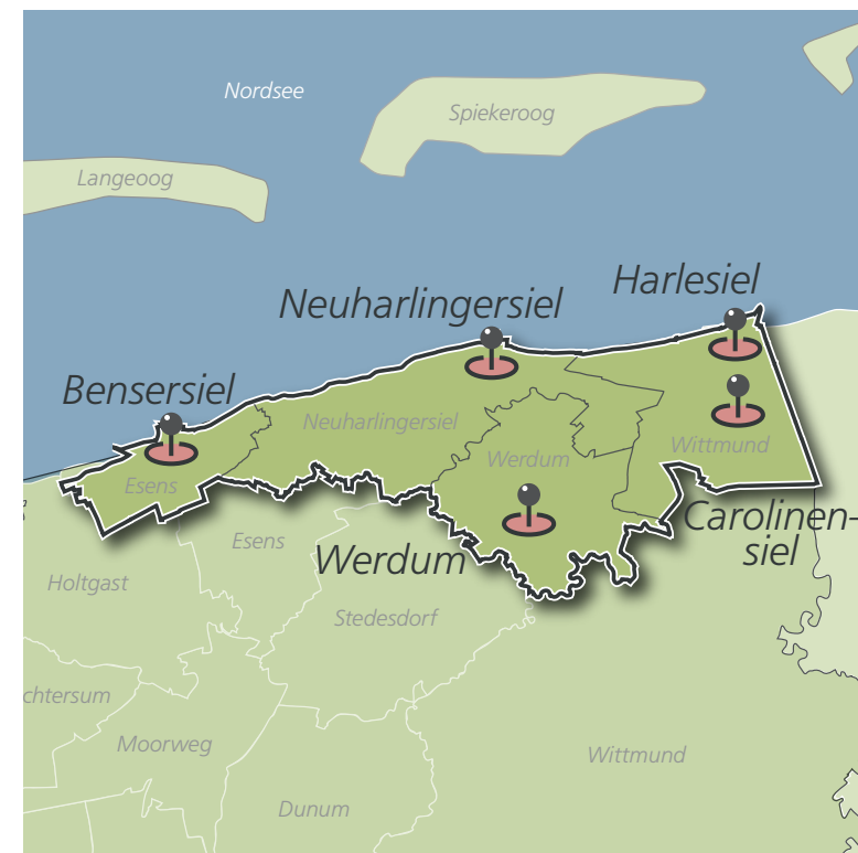
Lage der Dorfregion im Landkreis Wittmund

mit dem Ortsteil Bensersiel (Stadt Esens), der Ortschaft Carolinensiel-Harlesiel (Stadt Wittmund) sowie den Gemeinden Neuharlingersiel und Werdum