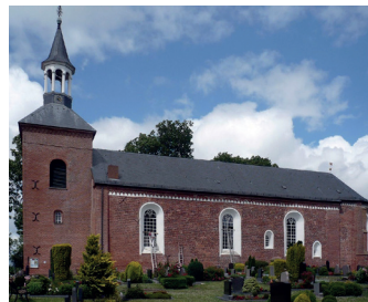
St.-Nicolai-Kirche in Werdum