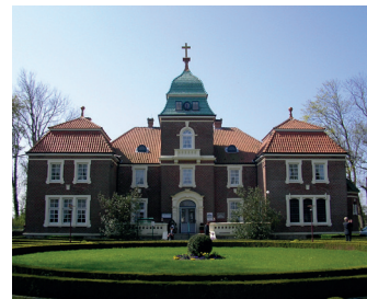
Sielhof in Neuuharlingersiel